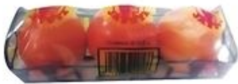
Tomate para Ensalada De Estados Unidos En Tubo. Pqte. de 3 Reg. $1.69 Pqte.