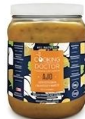
Cooking with My Doctor Ajo. De Puerto Rico Env. de 64 oz. Reg. $7.99