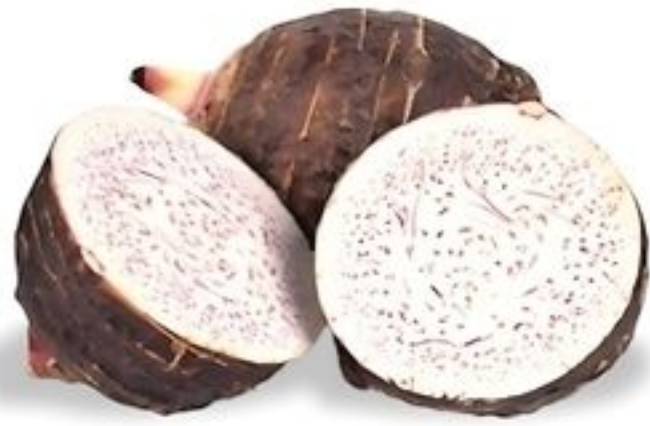
Malanga Lila De Nicaragua Reg. 99¢ Lb.