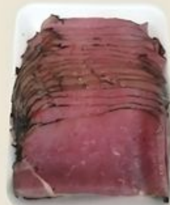
Cherry Hill Pastrami de Res Rebanado. Prev. Cong. De Estados Unidos Reg. $5.89 Lb.