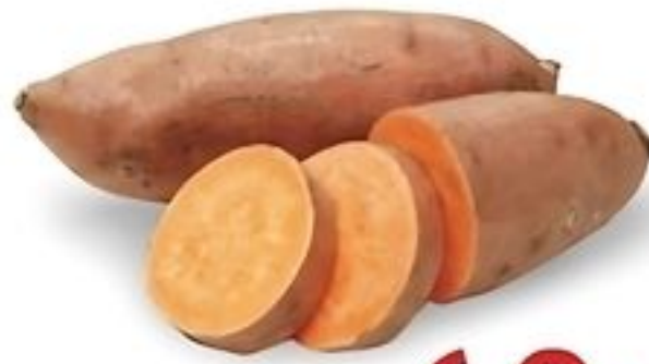
Batata Mameya De Estados Unidos Reg. 99¢ Lb.