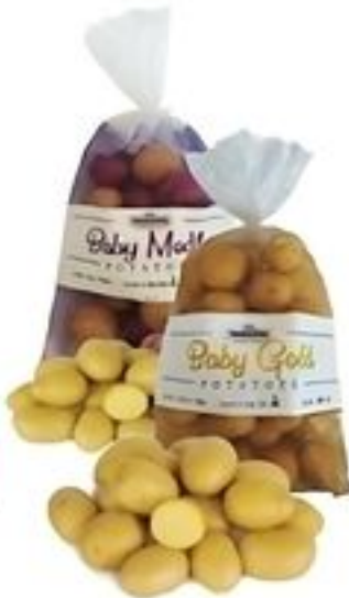
Mountain King Baby Potato Golds, Reds, Medleys Pqte. de 1.5 Lbs. Reg. $3.99 Pqte.