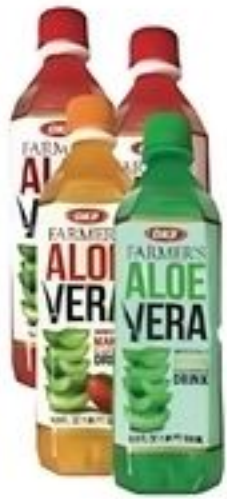
OKF Farmers Bebidas Aloe Vera Variedad Bot. de 16.9 oz. Reg. $1.69 c/u Especial $1.25 c/u