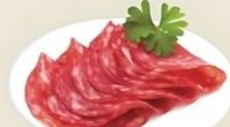
Lido Genoa Salami De Estados Unidos Reg. $5.29 Lb.