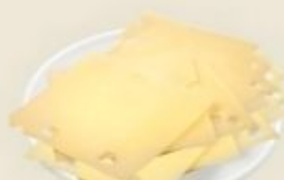
Queso Suizo Rebanado De Estados Unidos Reg. $5.69 Lb.