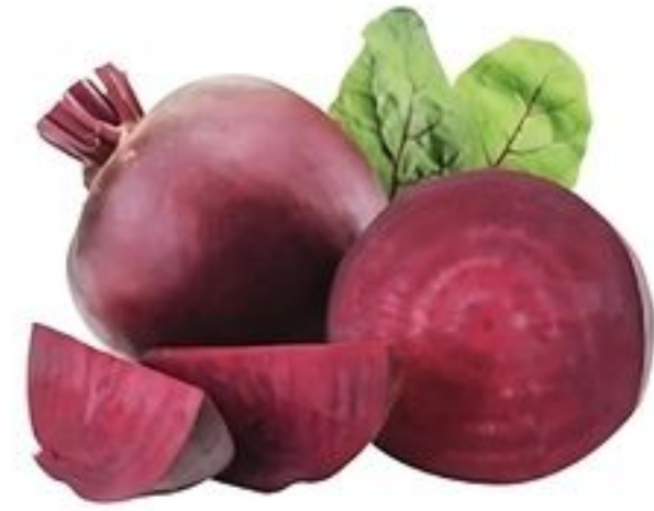
Remolacha De Costa Rica Reg. $1.19 Lb.