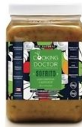
Cooking with My Doctor Sofrito con Curcuma y Aji Dulce De Puerto Rico Env. de 64 oz. Reg. $6.99