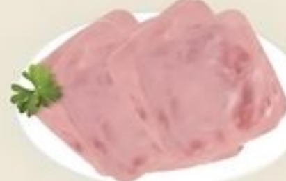
Numeat Jamón Cocido 4 x 4. 10% Rebanado De Puerto Rico Reg. $2.99 Lb.