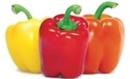
Pimiento Tricolor De República Dominicana Pqte. de 3 Unid. Reg. $3.99 Pqte.