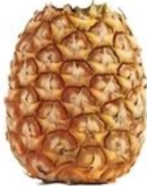
Piña sin Corona De Costa Rica Reg. $1.19 Lb.