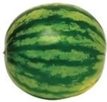
Melón de Agua Entero De República Dominicana Reg. 99¢ Lb.