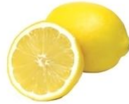
Limón Amarillo De Estados Unidos Pqte. de 2 Lbs. Reg. $3.49 Pqte.