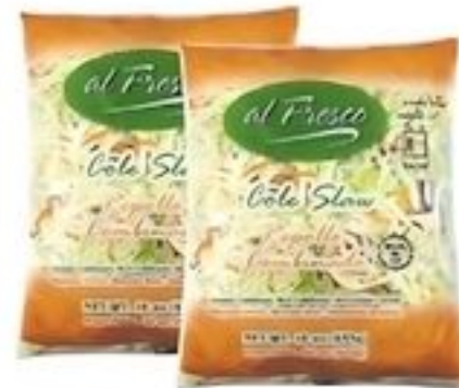
Al Fresco Cole Slaw De Estados Unidos Pqte. de 16 oz. Reg. $2.99 c/u Esoocial $2.50 c/u