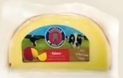
Castillo de Holanda Queso de Bola De Holanda Pqte. de 8 oz. Reg. $4.99 Pqte.