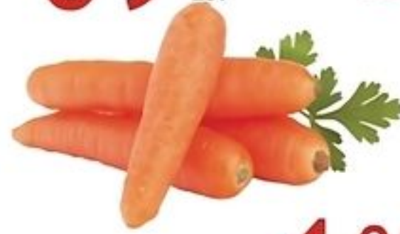
Zanahoria De Costa Rica Pqte. de 2 Lbs. Reg. $2.59 Pqte.