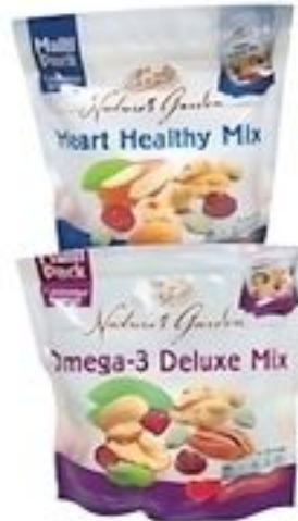
Nature's Gardens Berry Nutty, Cranberry Health, Health Mix, High Energy Mix, Omega 3 Deluxe Mix, Cashew, Almond Raw, Omega 3 Nut Mix De Estados Unidos Pqte. de 8.4 oz. Reg. $5.99 c/u