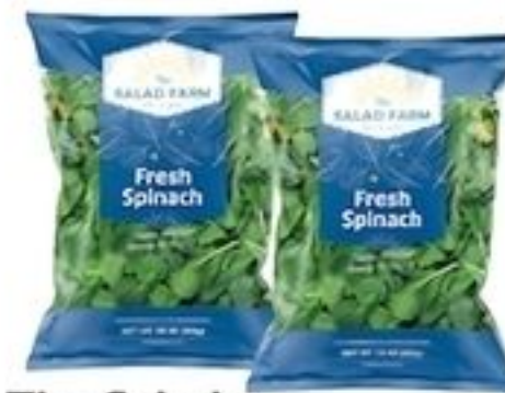
The Salad Farm Espinaca De Estados Unidos Pqte. de 10 oz. Reg. $2.99 c/u Especial $2.50 c/u